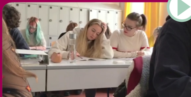
21 LÄCHELNDE GESICHTER