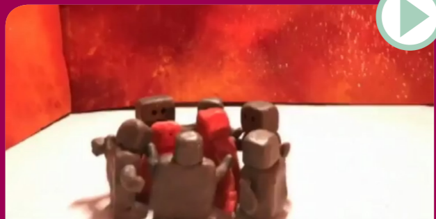
ALLEIN EINZIGARTIG – GEMEINSAM GROSSARTIG