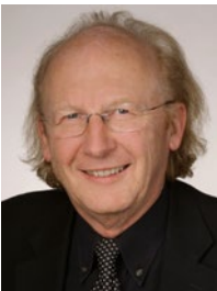
Dr. Artur WECHSELBERGER Präsident der Österreichischen Ärztekammer

Gebärmutterhalskrebs zählt zu den wenigen Krebsarten, denen man weitgehend vorbeugen kann – durch regelmäßige Krebsabstriche und durch die Impfung gegen humane Papillomaviren. Getreu dem Prinzip „Vorbeugen ist besser als heilen“ begrüßt die Österreichische Ärztekammer die Aufnahme der HPV-Impfung ins Gratis-Kinder-Impfprogramm. Es wäre wünschenswert, dass möglichst viele Österreicherinnen und Österreicher für sich und ihre Kinder diese Chance wahrnehmen.