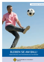
„Bleiben Sie am Ball“ Krebsvorsorge und Früherkennung für Männer