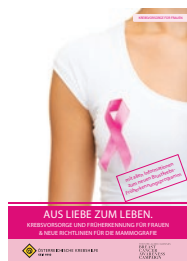
„Krebsvorsorge und Früherkennung für Frauen“ mit allen Richtlinien für das neue Brustkrebs-Früherkennungsprogramm

Lesen Sie alles Wissenswerte zum Thema „Krebsfrüherkennung für Frauen“ und „Krebsfrüherkennung für Männer“ in den beiden Krebshilfe-Broschüren. Kostenlos erhältlich bei der Krebshilfe in Ihrem Bundesland (siehe S. 27) oder als Download unter: www.krebshilfe.net