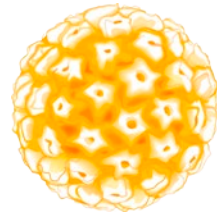
1. Schiller JT and Davies B. Nat Rev Microbiol 2004; 2:343–347.

Sie unterscheiden sich in der Zulassung und Wirksamkeitsbreite (siehe Darstellung auf Seite 13).