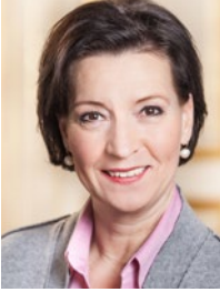
Gabriele HEINISCH-HOSEK Bundesministerin für Bildung und Frauen

Für die eigene Gesundheit sind Vorsorge und Prävention das Um und Auf. Deswegen bin ich sehr froh, dass es gelungen ist, die HPV-Impfung in das Kinderimpfprogramm aufzunehmen. Als Bildungsministerin ist es mir auch wichtig, dass alle Kinder in der 4. Schulstufe kostenlos geimpft werden und das Angebot direkt bei den SchulärztInnen wahrnehmen können. Das ist ein wichtiger Beitrag zum Schutz und zur Gesundheit unserer Mädchen und Buben.