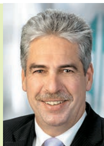
Dr. Hans Jörg Schelling ist Vorsitzender des Verbandsvorstandes im Hauptverband der österreichischen Sozialversicherungsträger.