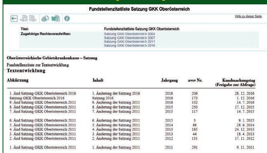
Abbildung 2: Auszug der SozDok-Liste „Fundstellenzitate zur Textentwicklung“ der Satzung der OÖGKK

Beispiel: Suche nach den Fundstellen einer Durchführungsvorschrift 16 der Oberösterreichischen Gebietskrankenkasse (OÖGKK), z. B. der Satzung der OÖGKK: