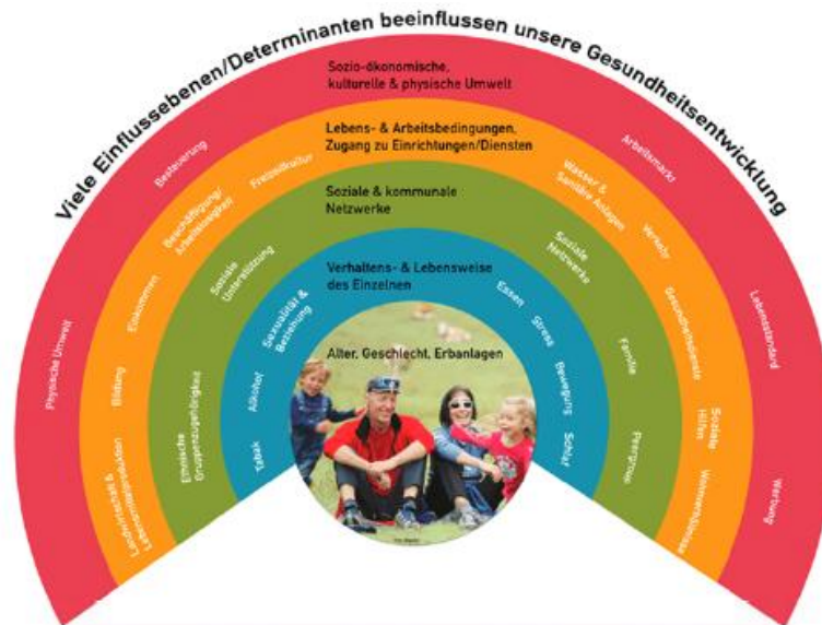
Abbildung 4 Determinantenmodell der Gesundheit, Dahlgren und Whithead, 1991