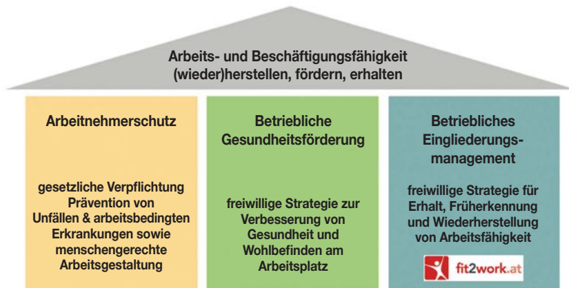
Abbildung 2: © itworks Personalservice GmbH

sonders wichtig, das Angebot von fit2work weiterhin in Anspruch nehmen zu können. Unter Einhaltung der Sicherheitsmaßnahmen sind persönliche Beratungen, aber auch telefonische und Online-Beratungen auch weiterhin möglich. Die Erfahrungen der beratenden Personen zeigen, dass während des Lockdowns und auch darüber hinaus gute Ergebnisse mit der telefonischen Beratung erzielt werden konnten. Den Kunden ermöglicht die telefonische Beratung zudem eine schnellere und flexiblere Terminvereinbarung, da die Beratung regional unabhängig ist und Anfahrtswege sowie zusätzliche zu berücksichtigende Betreuungspflichten wegfal-