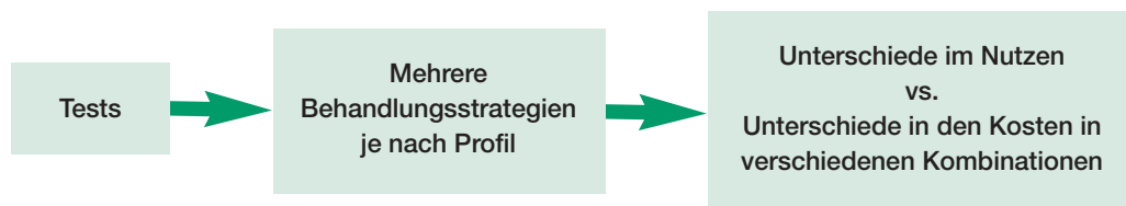
ABBILDUNG 2: GESUNDHEITSÖKONOMISCHE EVALUATION IM BEREICH DER PRÄZISIONSMEDIZIN (GRAFISCHE DARSTELLUNG)

Im Bereich der Präzisionsmedizin ist die gesundheitsökonomische Evaluation um einiges komplexer, da nicht nur zwei, sondern mehrere Behandlungsstrategien je nach Profil infrage kommen, wodurch sich auch verschiedene Kosten-Ergebnis-Kombinationen ergeben (siehe Abbildung 2). Hinzu kommt hierbei, dass die Kosten und Ergebnisse zwar grundsätzlich wie bei herkömmlichen Therapien geschätzt werden können, aber ihre Bewertung um einiges schwieriger ist. Da sich die Präzisionsmedizin zudem häufig auf Tests zur Identifikation der richtigen Behandlungsstrategie stützt, kommt sozusagen eine weitere Stufe in der Bewertung hinzu, da die Behandlungsstrategie vom Testergebnis abhängig ist. Alles in allem ist die Durchführung einer gesundheitsökonomischen Evaluation im Bereich der Präzisionsmedizin um einiges aufwendiger und komplexer, wenn auch gleich in ihren Anforderungen, als bei den herkömmlichen Therapien, als Entscheidungshilfe für Entscheidungsträger*innen im Gesundheitswesen jedoch unabdingbar. Aus diesem Grund werden ihre größten Herausforderungen im Folgenden näher beschrieben.